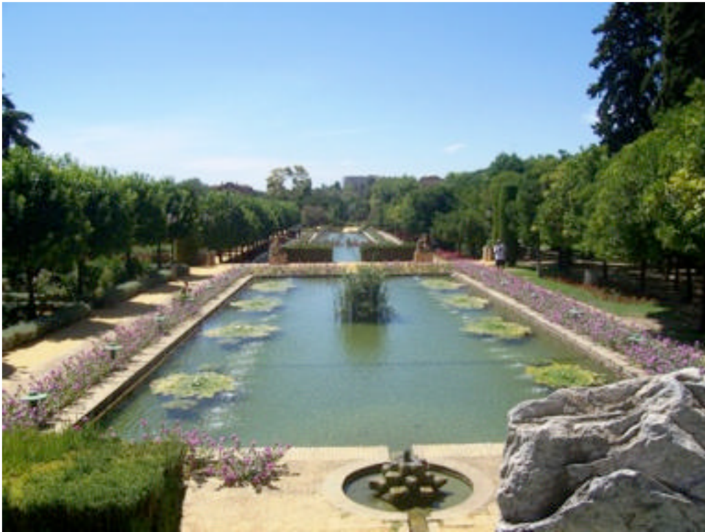
“MOVIMIENTO ARMÓNICO” de Víctor Rubio Juárez.