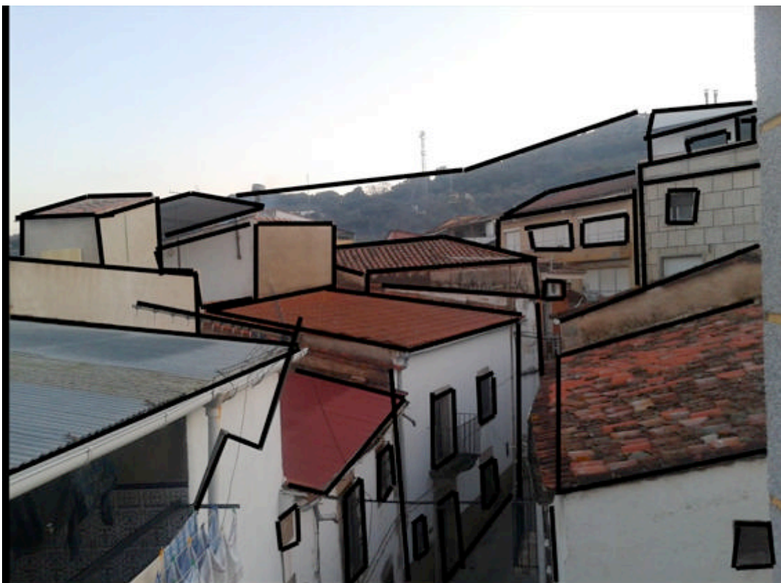
“CONJUNTO DISJUNTO” de Fátima Gil García.