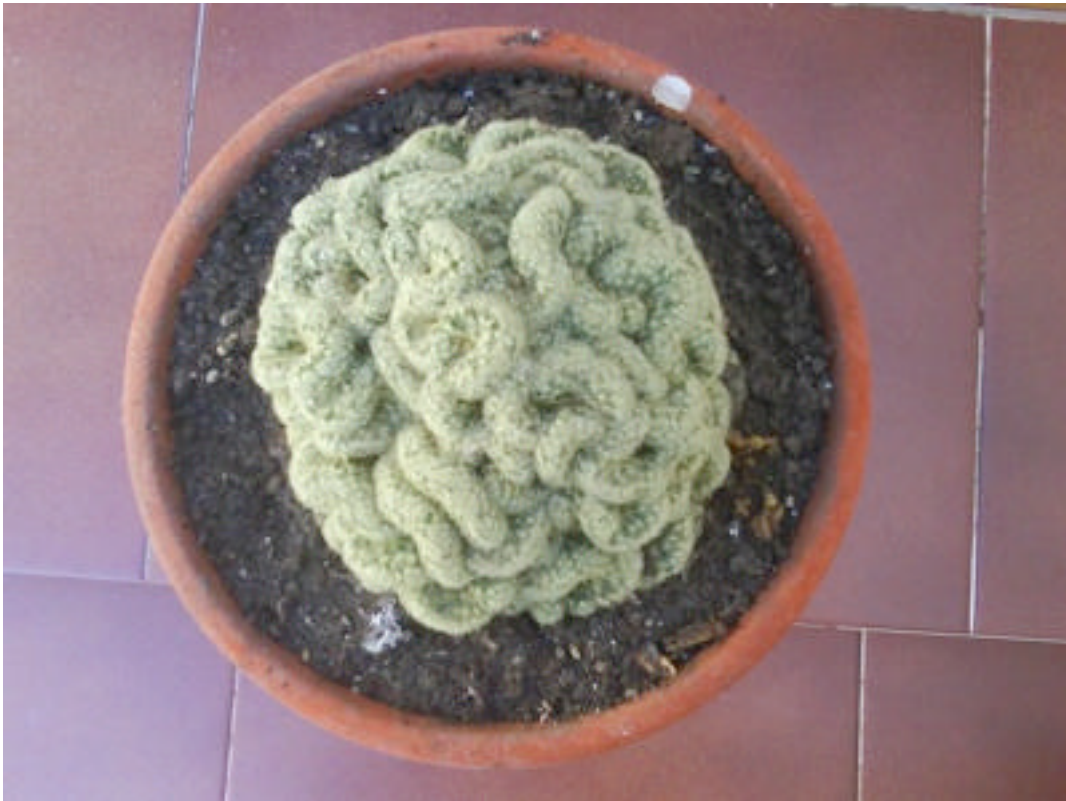
“HOMENAJE A MANDELBROT” de Miguel A. García Molero.