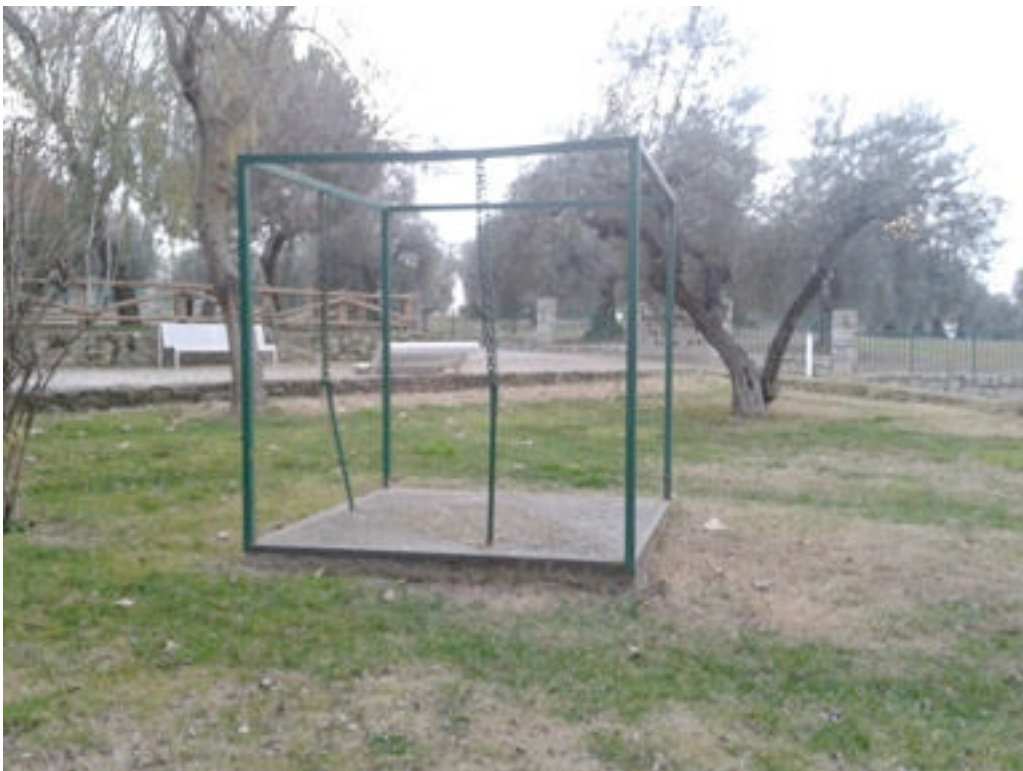
“CUBO DE OXÍGENO” de Beatriz Calvo Muñoz.